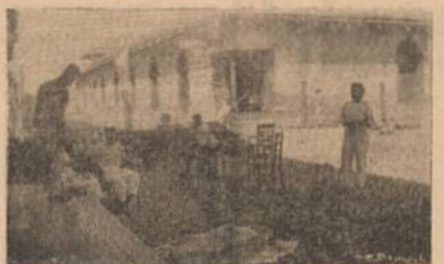
Esta fotografía fue tomada en los 6 días tras del ser poseído en la Calle Real de León, equis de días. La foto muestra el aspecto de la ciudad de León ocupada militarmente. Se ven soldados de Díaz marchando por las calles y los heridos en la calle Real.